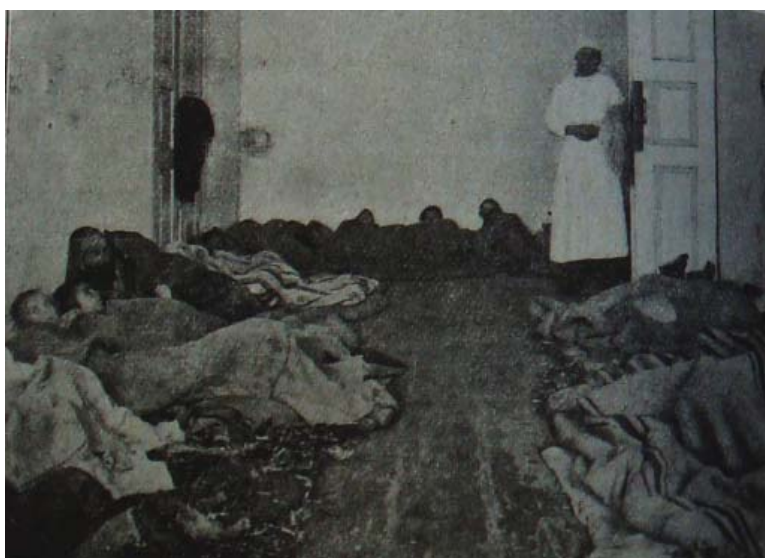
Copii înfometaji într-un spital din Zaporojie (Buletinul Comitetului Nansen nr. 22 din 30 aprilie 1922,)