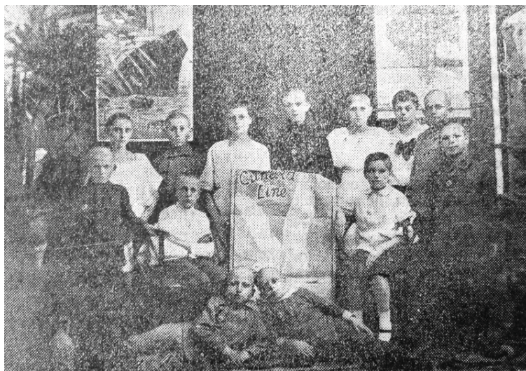
Copii evrei din Ucraina refugiați în România și transportați în SUA