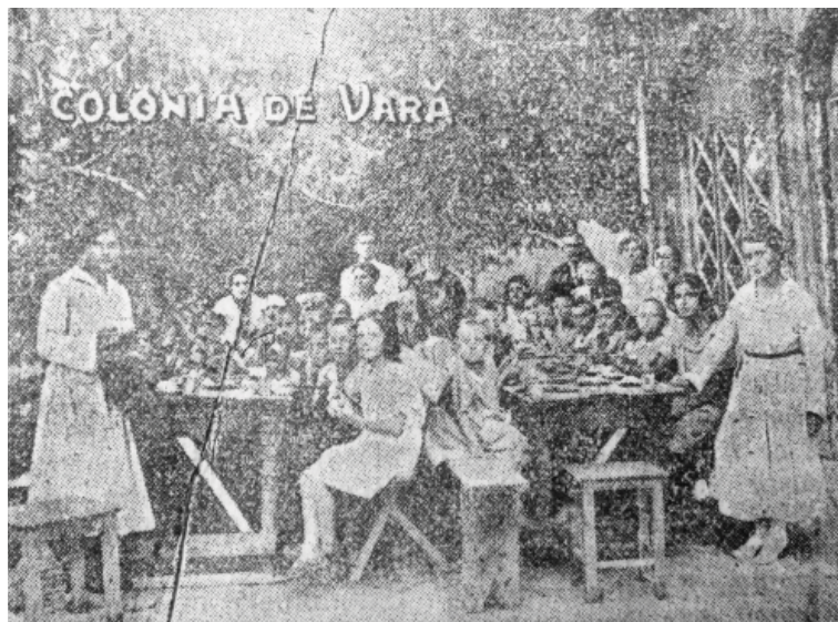
Colonie de vară a refugiaților evrei din Ucraina, organizată de JDC în România ( Curierul Israelit )

La începutul lunii noiembrie 1922, I. Adler, reprezentantul în Harkov al Comitetului Internațional Evreiesc de Ajutorare, informa comisia din România despre noua rută de transport a ajutoarelor din țară pentru evreii din Ucraina – Galați-Constantinopol. Renunțarea, până în primăvara anului 1923, la direcțiile precedente – căile terestre deveniseră impracticabile din cauze meteorologice. Ajutoarele care se mai aflau în Tighina la acea dată – 3 vagoane