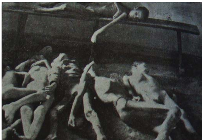
Copii victime ale foametei la morga din Herson (Buletinul Comitetului Nansen nr. 22 din 30 aprilie 1922, Arhiva Ministerului Afacerilor Externe al României )

În timp ce Bacilieri se afla la Harkov pentru a stabili modalitatea de transport a ajutoarelor destinate